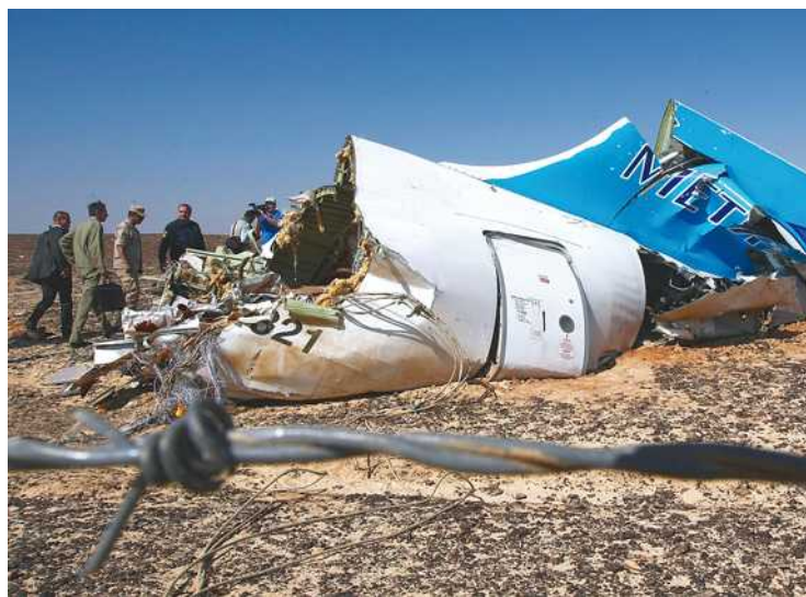
L'avion, parti d'Égypte, était à destination de la Russie.