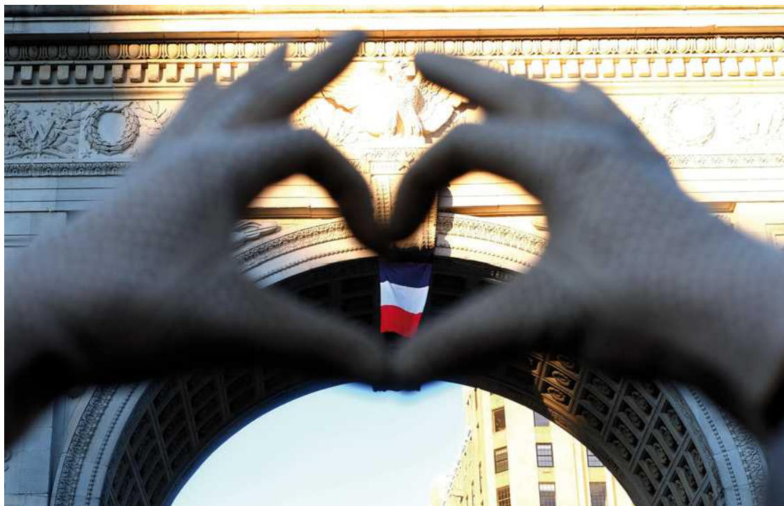
Une femme a entouré d'un cœur (fait avec les doigts) le drapeau français accroché sur un célèbre monument de Washington, la capitale des États-Unis (Amérique), samedi.

{ Le mot anglais du jour } avec MY WEEKLY : song