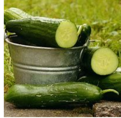
longs verts maraîcher